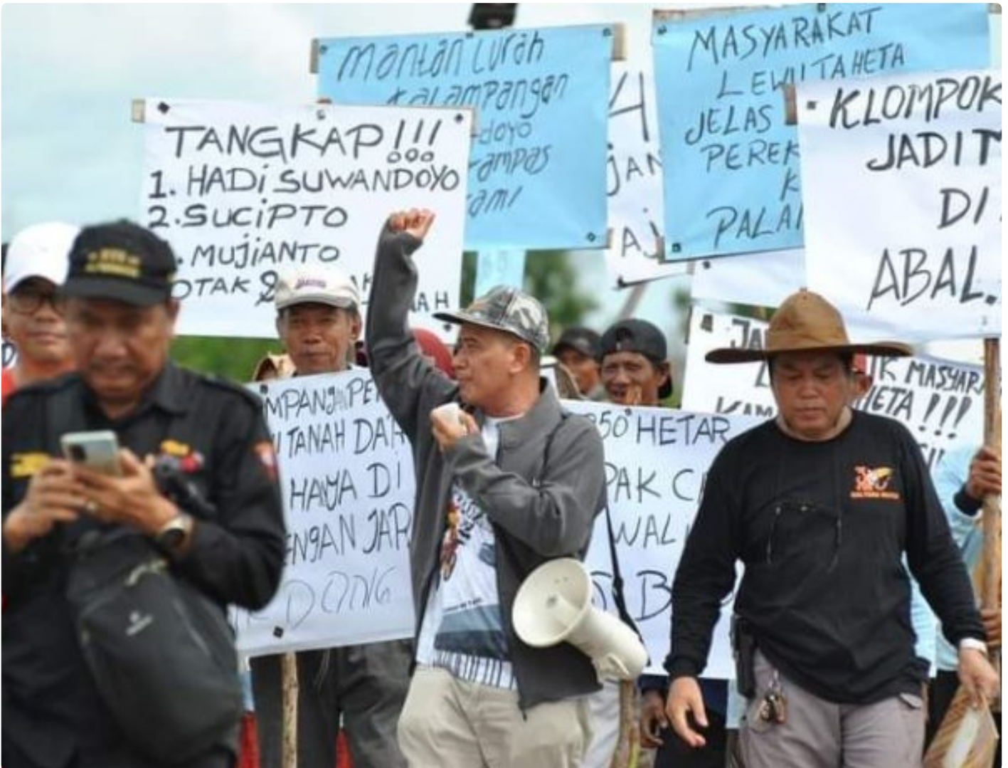
Gambar: Aksi Unjuk Rasa Masyarakat Kelompok Tani

PALANGKA RAYA - Sengketa kepemilikan tanah yang terjadi di Kota Palangka Raya selama ini, cukup meresahkan. Hal ini tentunya bisa mempengaruhi geliat pembangunan di ibukota provinsi Kalimantan Tengah (Kalteng) kedepannya.